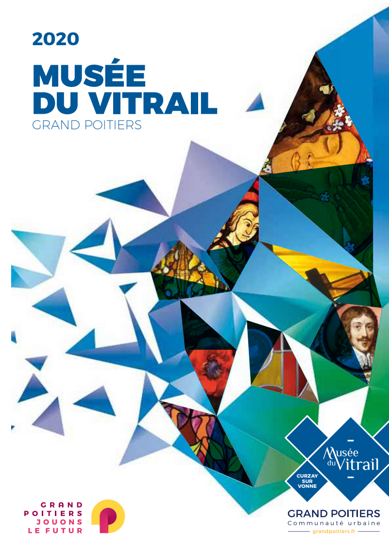
Plaquette de présentation du Musée du Vitrail, situé à Curzay-sur-Vonne

Toutefois, plusieurs études, dont une réalisée en 2003 dans le Languedoc-Roussillon, ont démontré que l'implantation d'éoliennes à proximité d'un site touristique a un impact faible sur la fréquentation de ce même lieu (Impact potentiel des éoliennes sur le tourisme en Languedoc-Roussillon, Conseil régional, CSA (2003)).